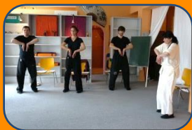
Qi Gong Kurs

Sie haben bei uns die Möglichkeit ein kostenloses Probetraining zu machen.