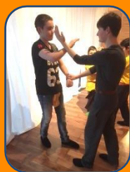
Wing Chun Kung Fu Kurs für Jugendliche