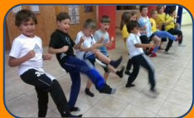
Wing Chun Kung Fu Kurs für Kinder