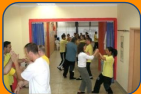
Wing Chun Kung Fu Kurs für Erwachsene

In allen EWCO Shaolin Centern findet mehrmals pro Woche in eigenen Gruppen Unterricht für Kinder, Jugendliche und Erwachsene statt.